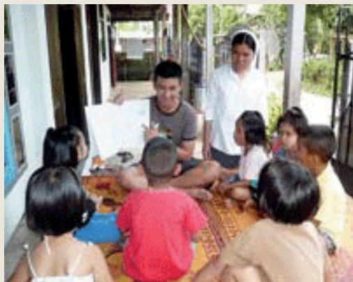
CPCR Janvier 2009

Le CPCR a été créé en 1982, et reconnu comme association caritative d'utilité publique en 2005. Depuis 1996 le CCFD-Terre solidaire soutient le CPCR alors qu'il lançait un projet de Réseau d'Assistance Technique dans les pays de la sous région, après la découverte de cas de trafic humain entre pays voisins. Le CPCR dispose aujourd'hui d'un réseau d'agences locales formées dans l'ensemble des pays du Mékong pour coordonner l'aide aux victimes. Il travaille en collaboration avec les autorités locales, les services d'immigration, les hôpitaux, les écoles, les juristes... Sa démarche consiste à offrir un processus complet de protection des enfants : suivi, investigation, vérification, aide sociale, réinsertion, mesures préventives d'autres abus. Cette approche multidisciplinaire est capitalisée pour favoriser les mêmes mécanismes et les mêmes législations dans toutes les régions de Thaïlande et développer des centres de référence dans les différents pays du sud est asiatique.