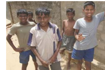
Enfants au Sri Lanka

Notre travail consiste à supporter les organisations de paix locales suite à leur demande grâce à des équipes de professionnels internationaux qui facilitent le dialogue entre communautés, protègent les défenseurs des droits de l'Homme, lient les ressources internationales aux acteurs locaux vulnérables.