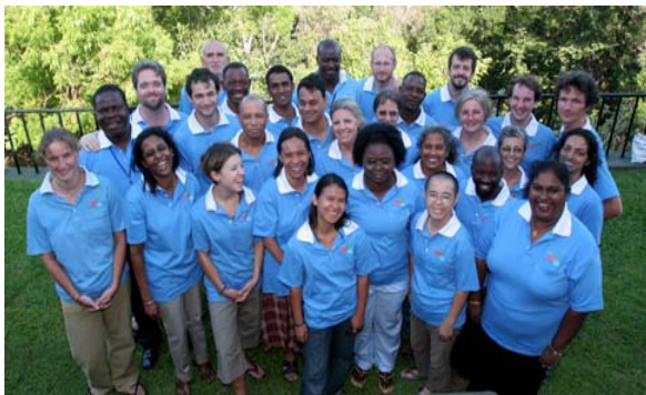
L'équipe de NP au Sri Lanka

Nos soutiens : des milliers de personnes à travers le monde soutiennent NP, notamment certains lauréats du Prix Nobel de la Paix comme Oscar Arias, le Dalaï Lama, Adolfo Pérez Esquivel, José Ramos Horta, Mairead Maguire, Rigoberta Menchu Tum and Lech Waleza.