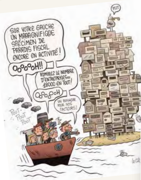
Partage des richesses