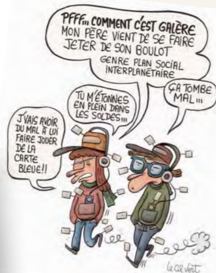
Économie sociale et solidaire