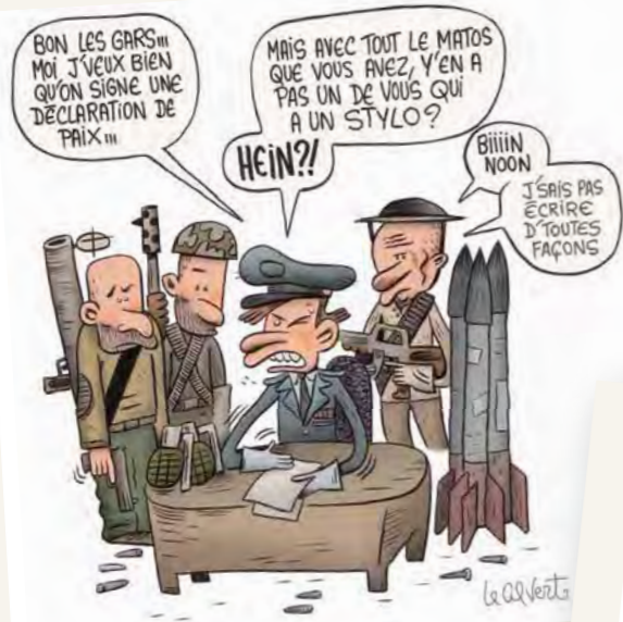
Préventions des conflits

Caricatures disponibles sur l'intranet du CCFD-Terre Solidaire dans la rubrique Publications et productions / Animation générale.