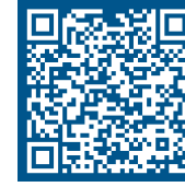
CCFD - Terre Solidaire Hauts-de-France