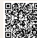
Ferme du maraîchon