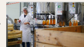
Institut de Genech