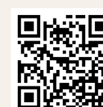
Les agneaux du Pré