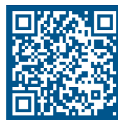
Institut de Genech