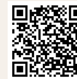
La miellerie de Landas