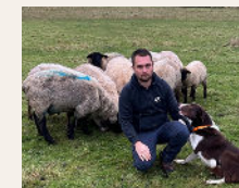
Les agneaux du Pré