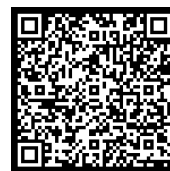
Cagnotte en ligne pour soutenir le projet