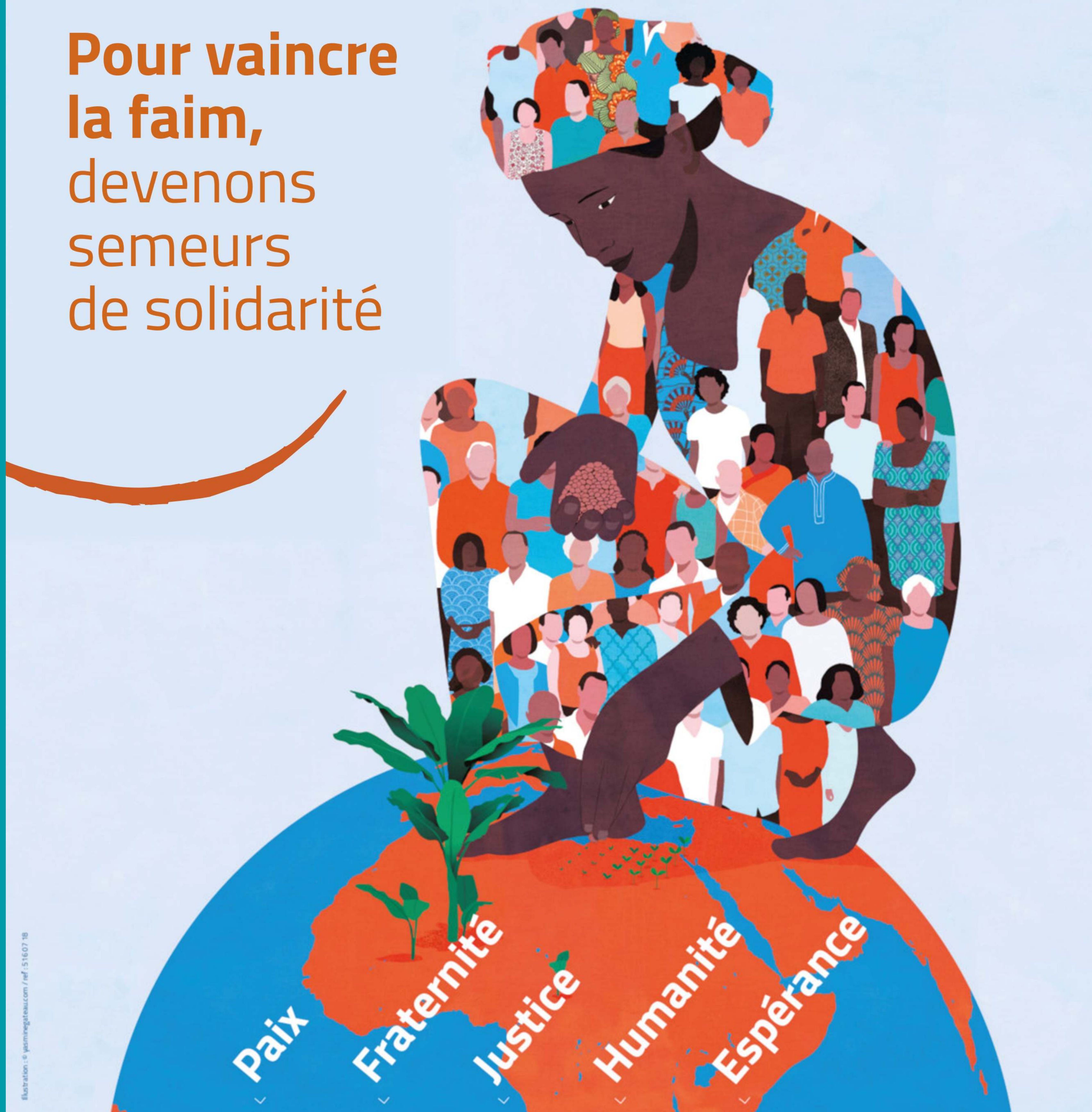
Illustration : © penninghaus.com / ref. 51807 38

Pour vaincre la faim, devenons semeurs de solidarité