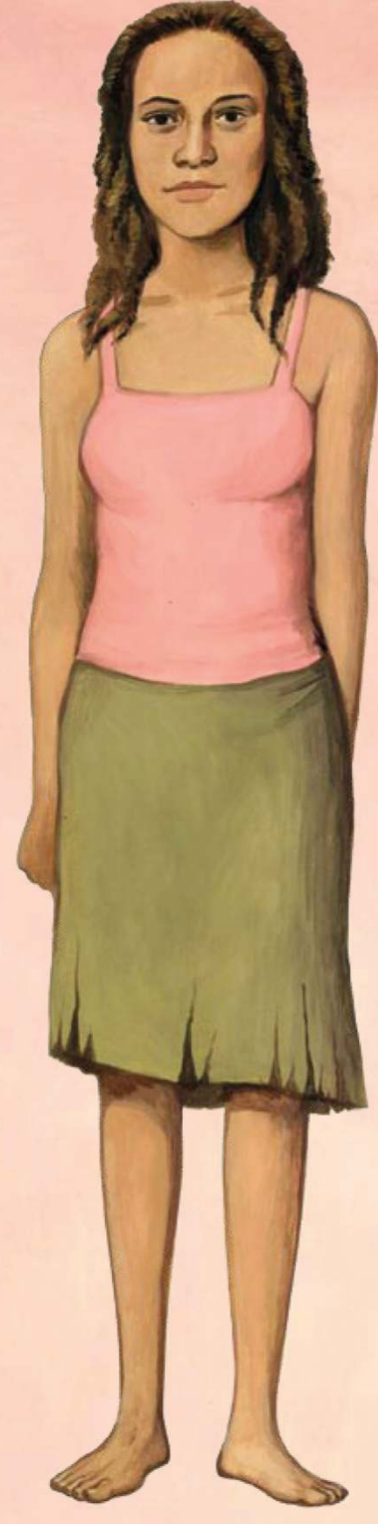
Illustration : Martin Hargreaves - A. E. B. / CC BY-NC-SA

Ceci n'est pas une enfant des rues de São Paulo. C'est une jeune femme qui a créé une coopérative.