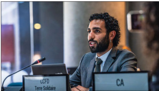
Le CCFD-Terre Solidaire, au titre de la société civile, participe aux négociations pour la Convention fiscale - Nairobi, novembre 2025