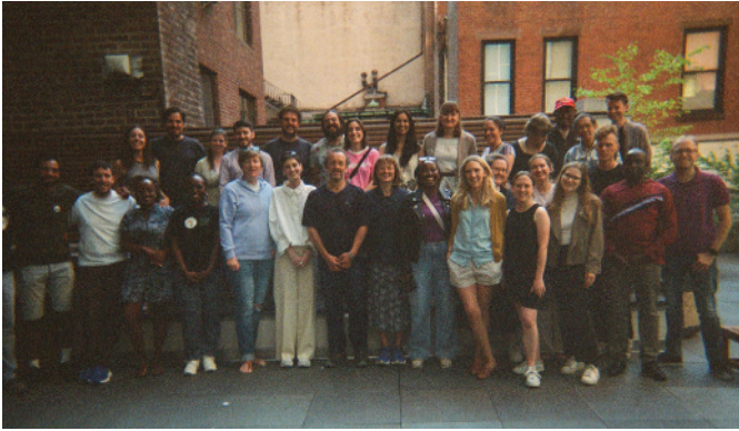
Veille de la première session de négociations de la Convention fiscale - New York, août 2025

Si le processus de négociation d'une Convention fiscale de l'ONU a pu voir le jour, c'est en grande partie grâce à plus d'une décennie de mobilisation continue de la société civile et des pays du Sud. Portée au niveau mondial par l'Alliance globale pour la justice fiscale (GATJ), ses réseaux régionaux et ses organisations membres – dont le CCFD-Terre Solidaire – cette mobilisation a permis de maintenir vivante l'exigence d'un espace fiscal multilatéral universel, inclusif et démocratique , là où les cadres existants avaient échoué. Par ses analyses, ses campagnes et son plaidoyer, la société civile a contribué à faire émerger une alternative crédible au cadre OCDE et à préparer le terrain politique et technique du processus onusien. Elle a ainsi joué un rôle structurant dans la reconnaissance, par les États, de la nécessité d'une réforme systémique de la gouvernance fiscale internationale.