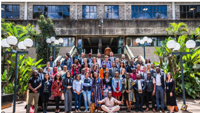
Organisations de société civile au siège de l'ONU pour la 3 e session de négociations de la Convention fiscale - Nairobi, novembre 2025

Présenté comme une « base minimale », le projet de texte a immédiatement suscité de fortes inquiétudes . Les éléments centraux du mandat – répartition des droits d'imposition, taxation des ultra-riches, transparence fiscale, lutte contre les flux financiers illicites, liens avec le climat et le développement durable – y apparaissaient de manière très limitée. Pour de nombreuses délégations du Sud, ce texte faisait planer le risque d'une Convention « vide », réduite à un cadre déclaratoire et renvoyant l'essentiel des engagements à des protocoles futurs incertains. La société civile a partagé cette alerte : une telle architecture reproduirait les logiques fragmentées et optionnelles qui ont conduit à l'échec des réformes pilotées par l'OCDE.