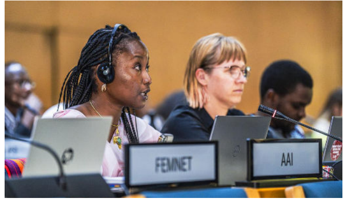
La société civile joue un rôle décisif pendant les négociations - Nairobi, novembre 2025